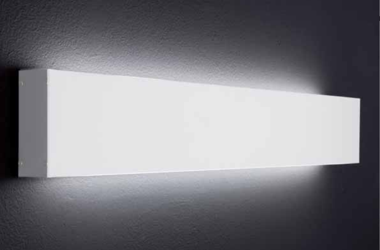
9446.2 T5 2x28W, G5